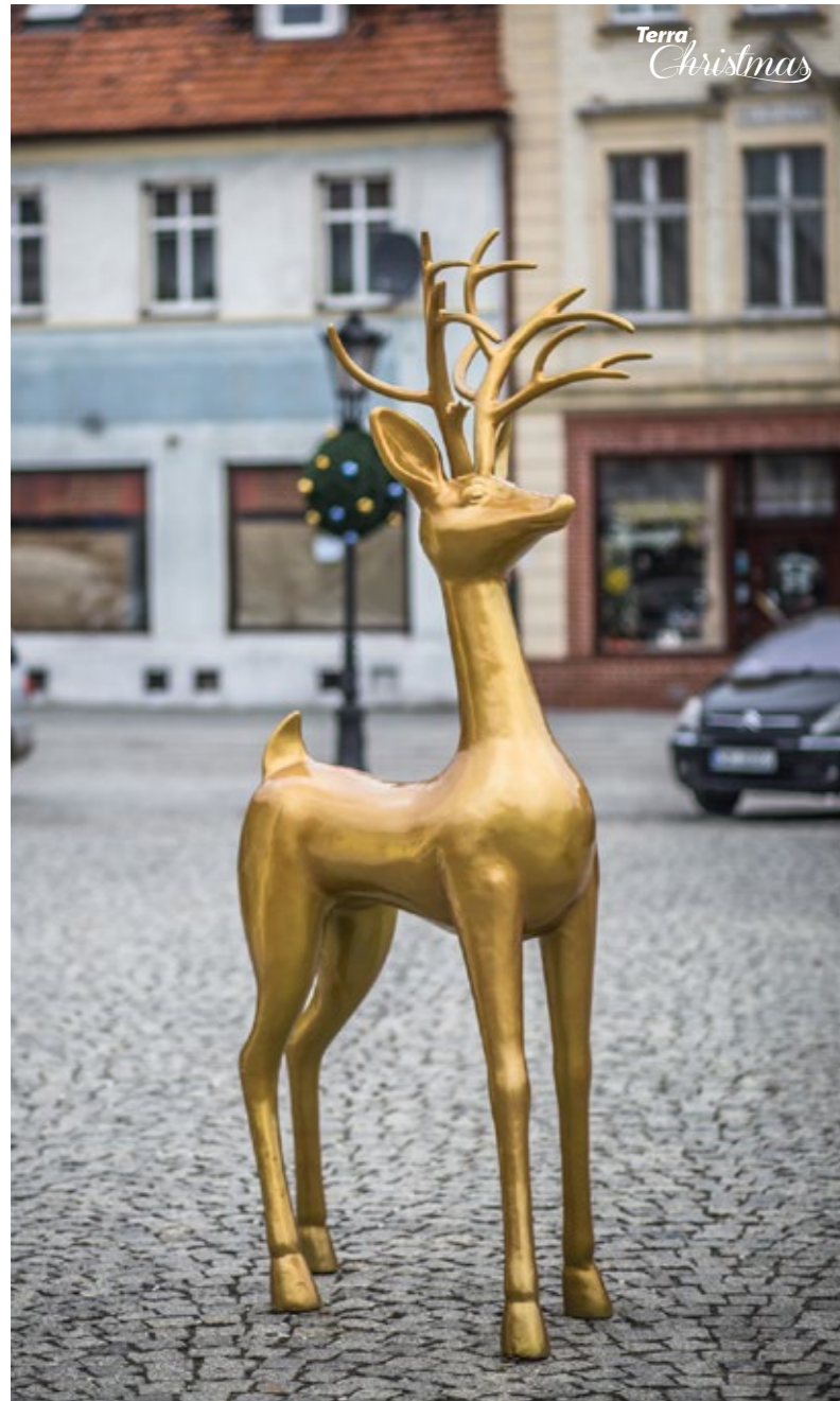
Figura Rudolf & Vánoční smrekový kulatý kryt Terra Christmas Ball Figúra Rudolf & Návlek Terra Christmas Ball