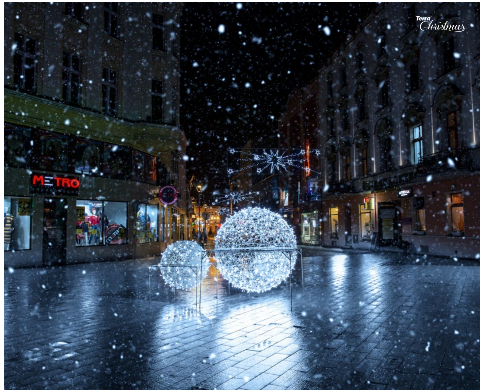
Pletené dekorace Koule 3D Ažúrové dekorácie Guľa 3D