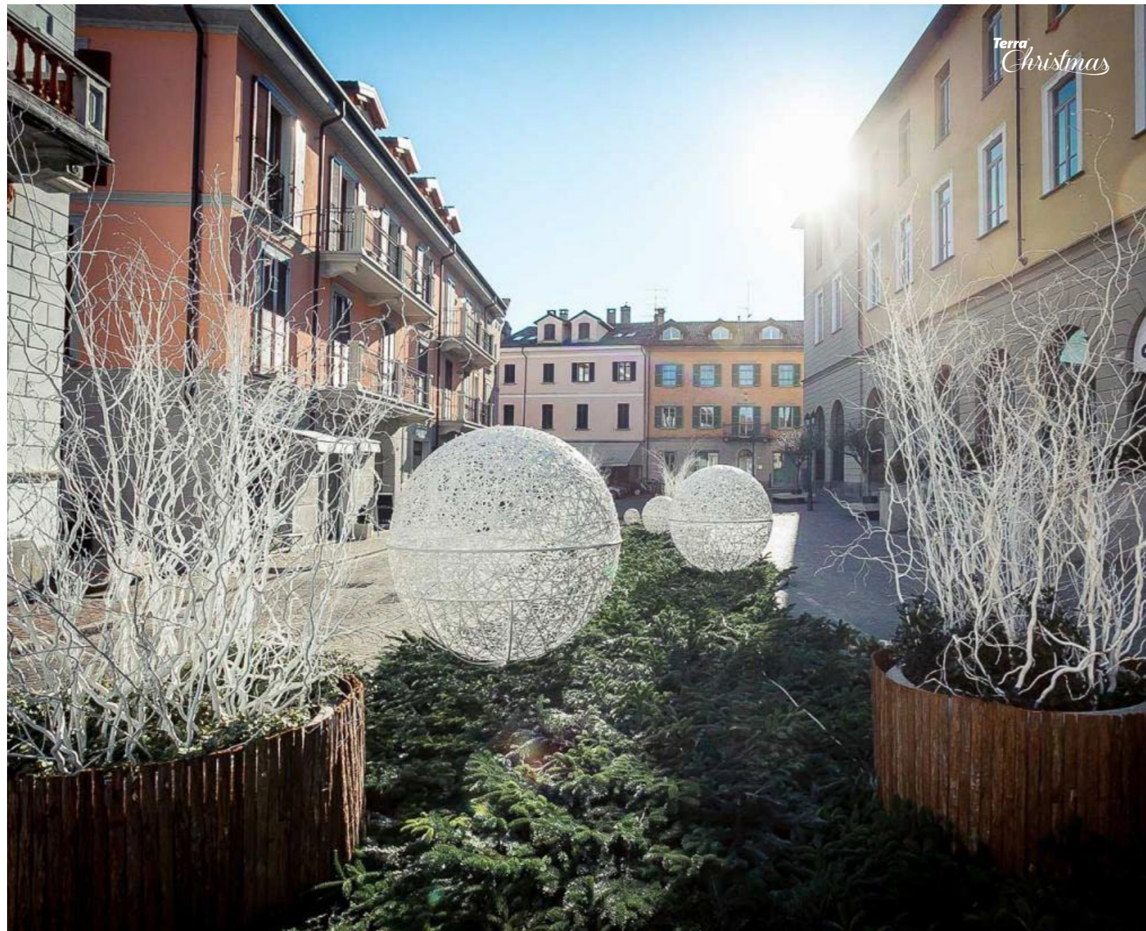
Pletené dekorace Globus 3D Ažúrové dekorácie Globus 3D