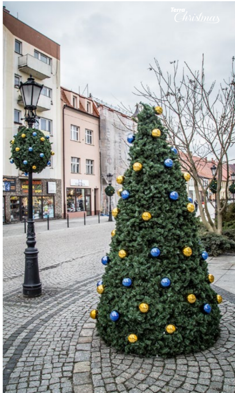
Vánoční návlek Terra Christmas Tree & Vánoční smrekový kulatý kryt Terra Christmas Ball Návlek Terra Christmas Tree & Návlek Terra Christmas Ball