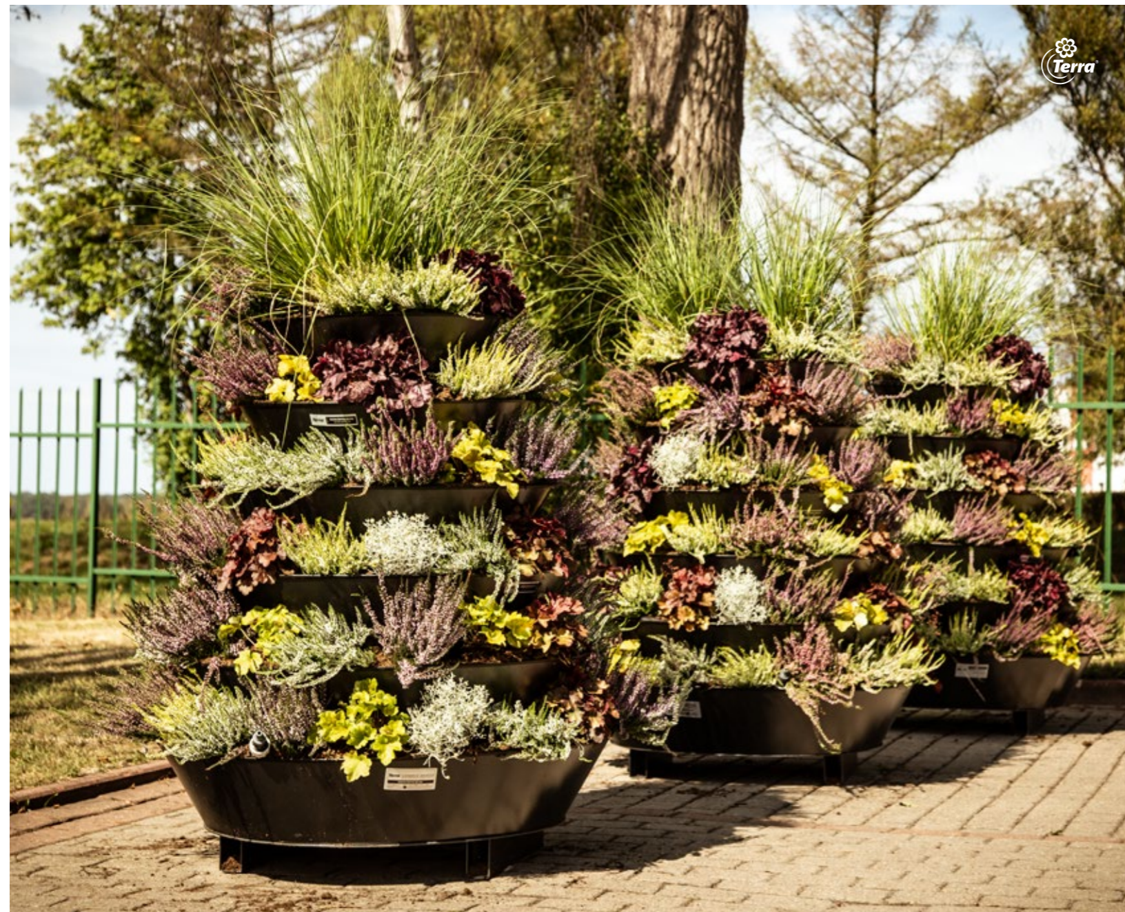
Květinové věže H1200 Kvetinová veža H1200