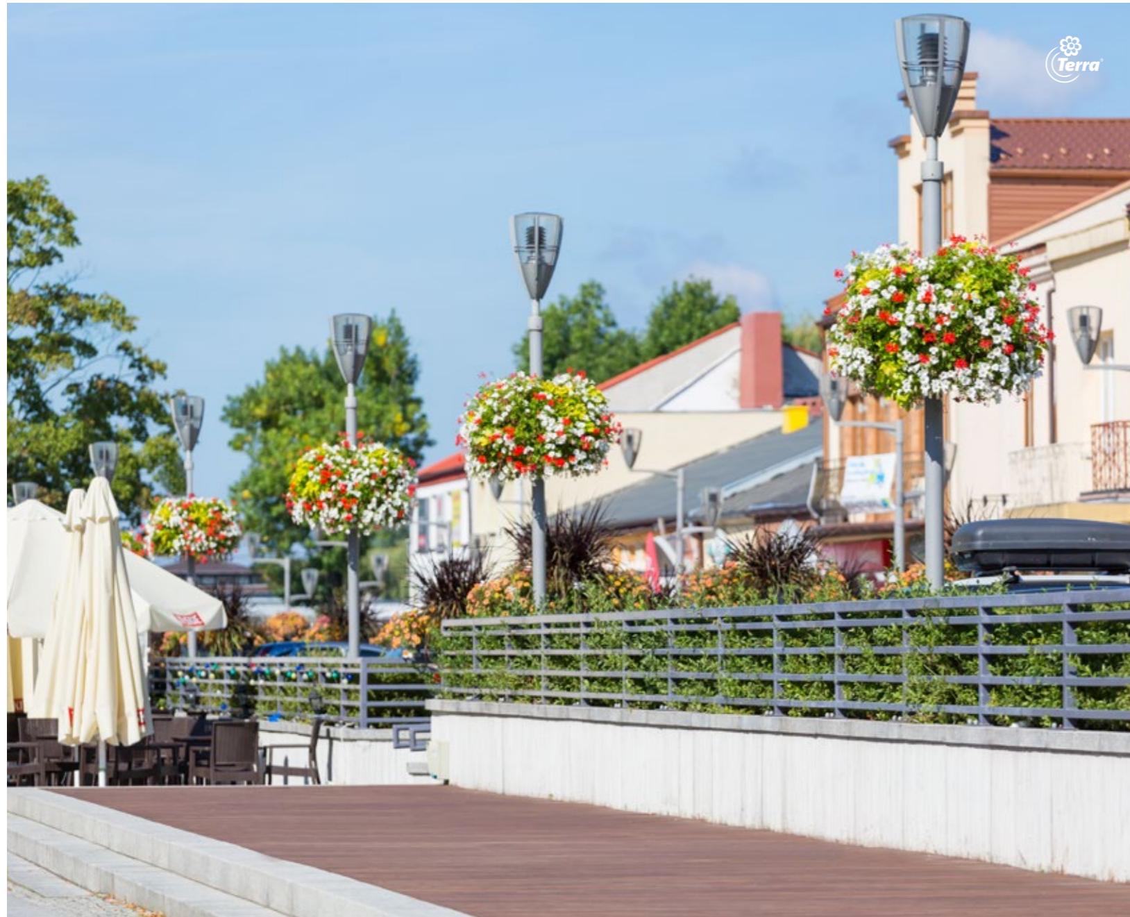
Květináče na lampy W600/2 Kvetinové nádoby na lampy W600/3