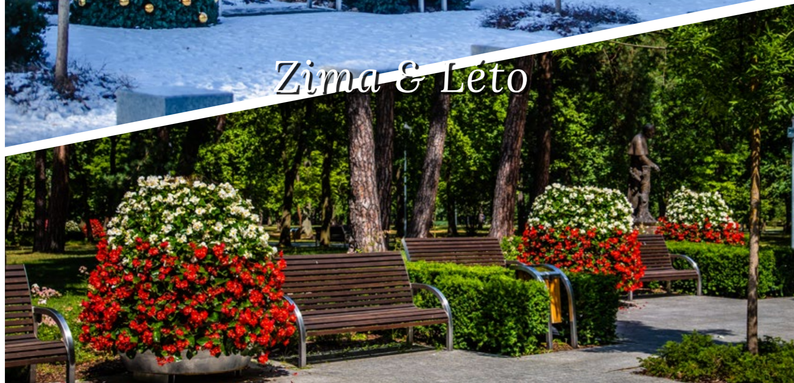
Vánoční návlek Terra Christmas Tree & Květinové věže Návlek Terra Christmas Tree & Květinové věže