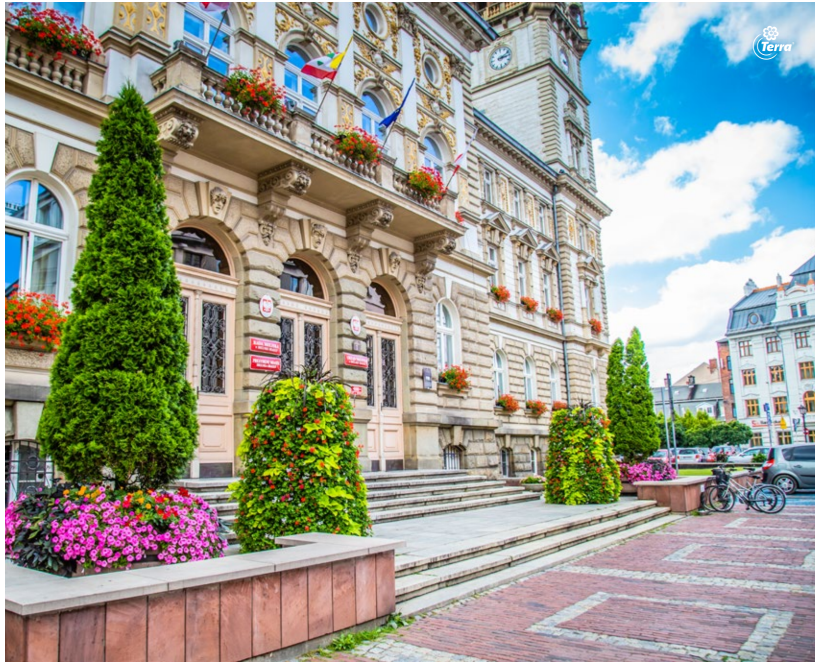
Květinové věže H2000 Kvetinové veže H2000