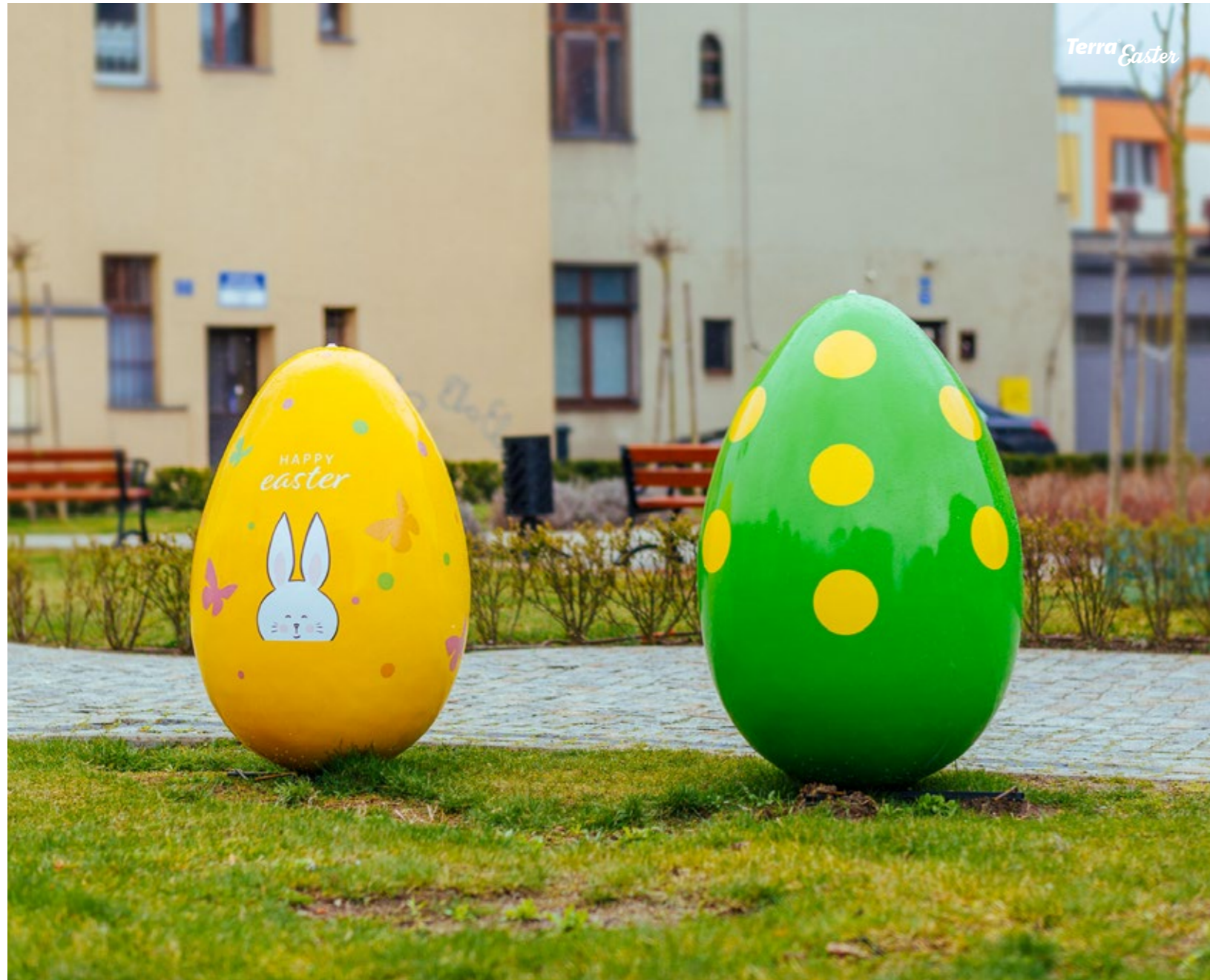
T120 & W150