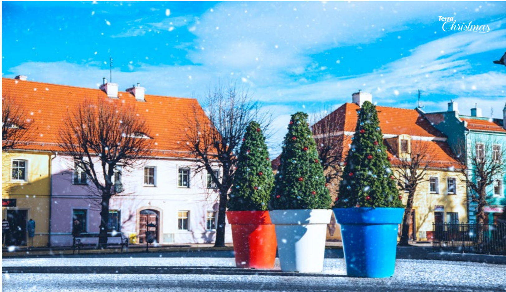
Vánoční návlek Terra Christmas Tree & květináč Gianto Classic Návlek Terra Christmas Tree & květináč Gianto Classic