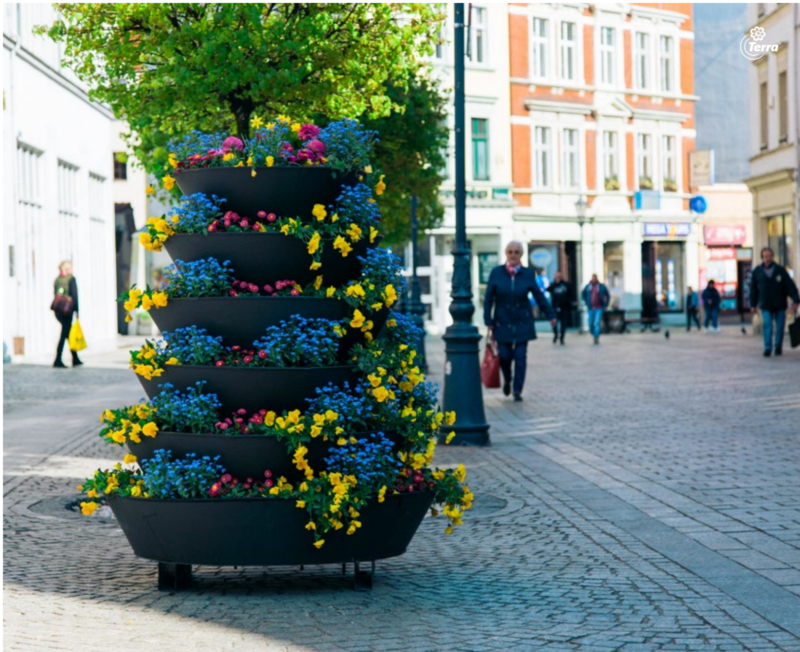
Květinové věže H1200 Kvetinové veže H1200