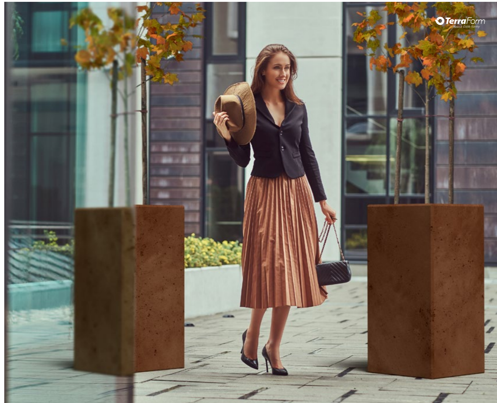
Květináče Schiobet 90 Kvetináče Schiobet 90