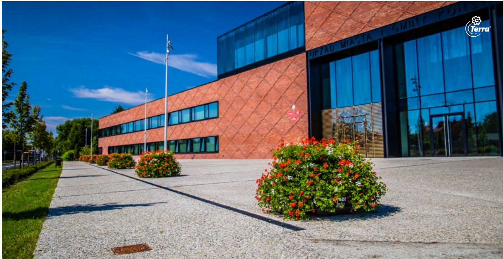
Květinové věže H700 Kvetinové veže H700