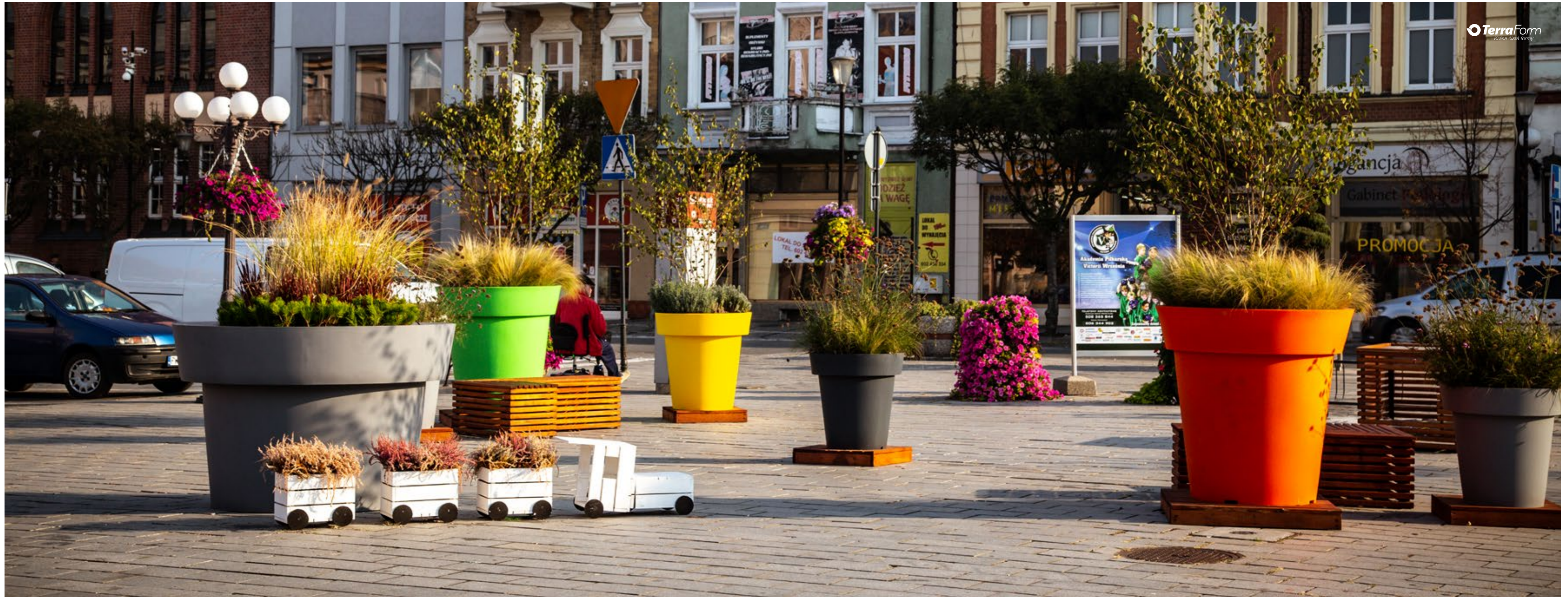
Květináče Gianto Tablo & Gianto Classic 120/95/80 Kvetináče Gianto Tablo & Gianto Classic 120/95/80