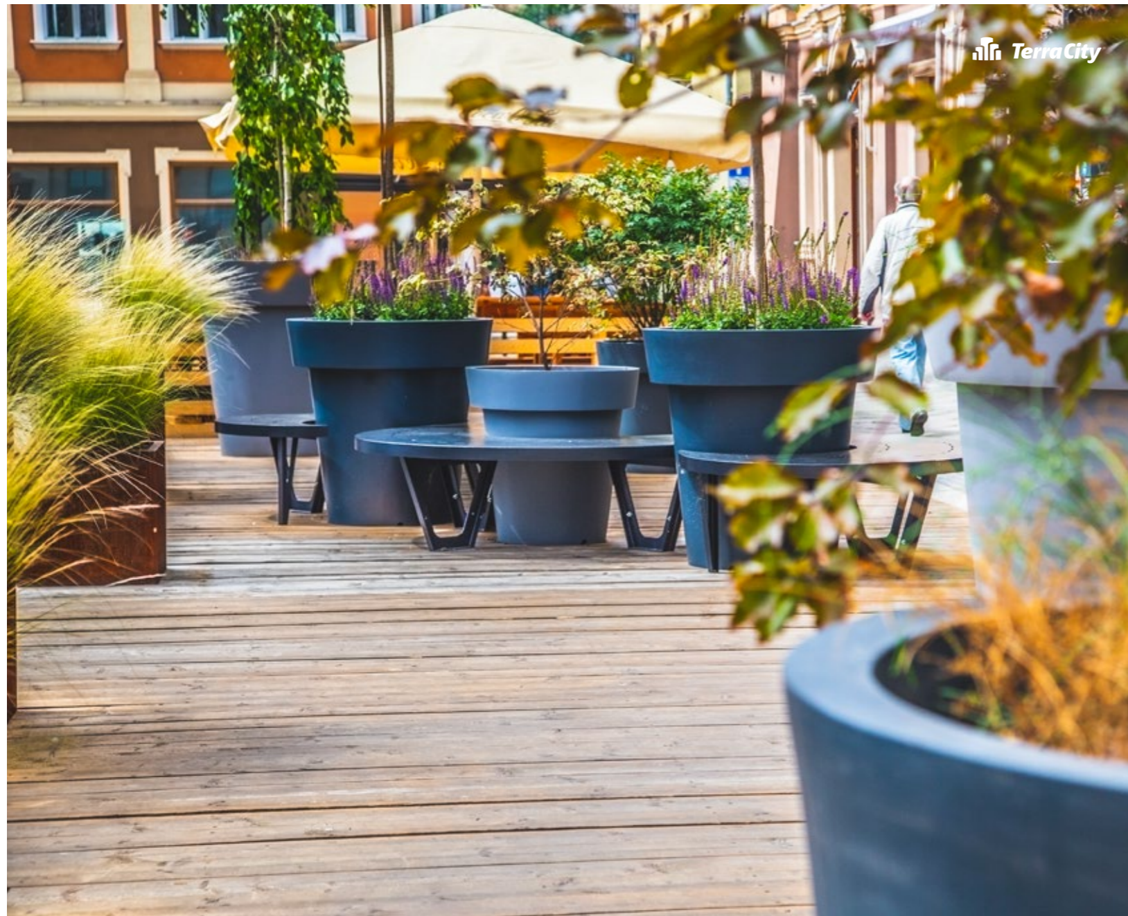
Komplet Triple do Gianto - Kolekce Wave Komplet Triple do Gianto - Kolekcia Wave