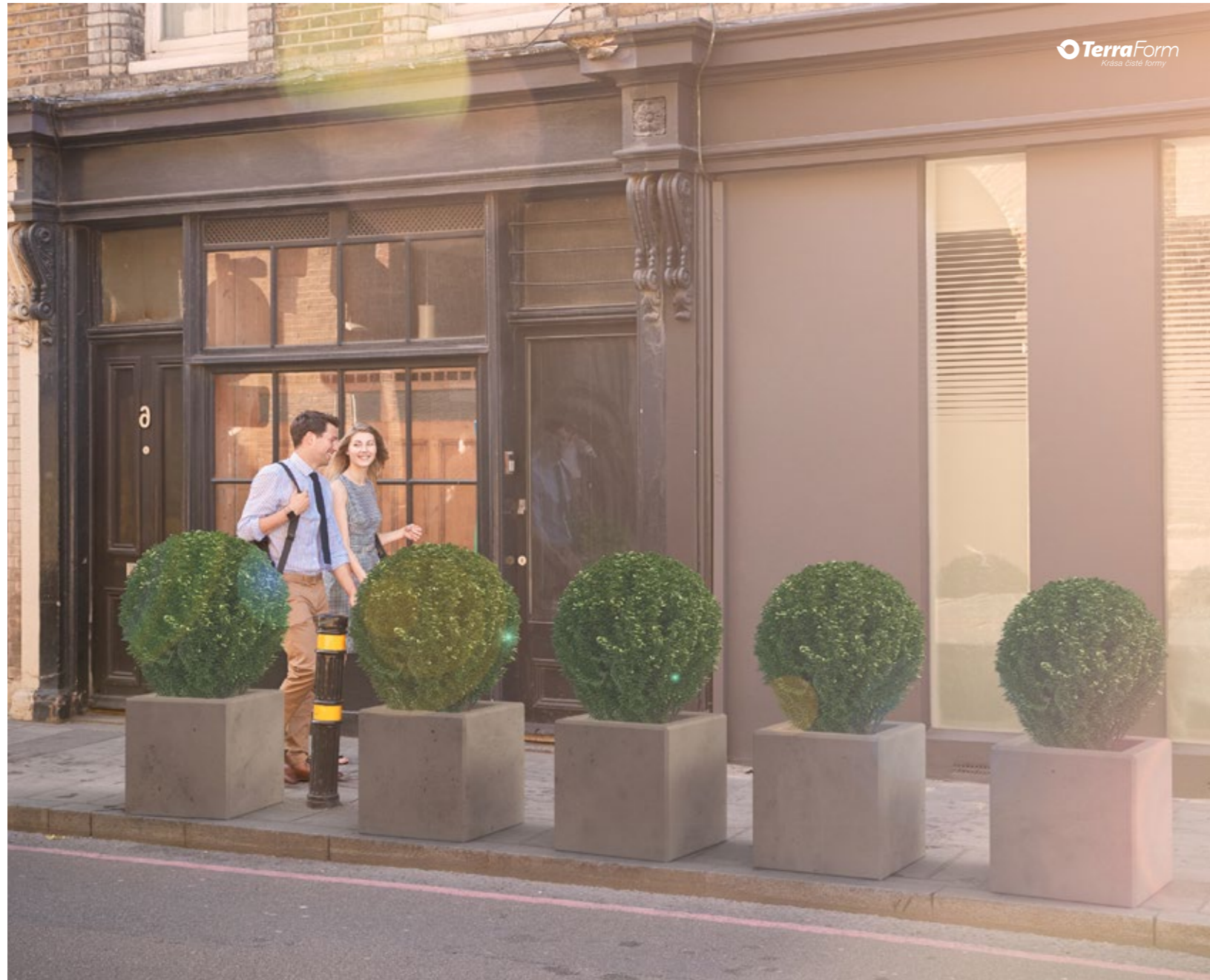
Květináče Tube 40 Kvetináče Tube 40