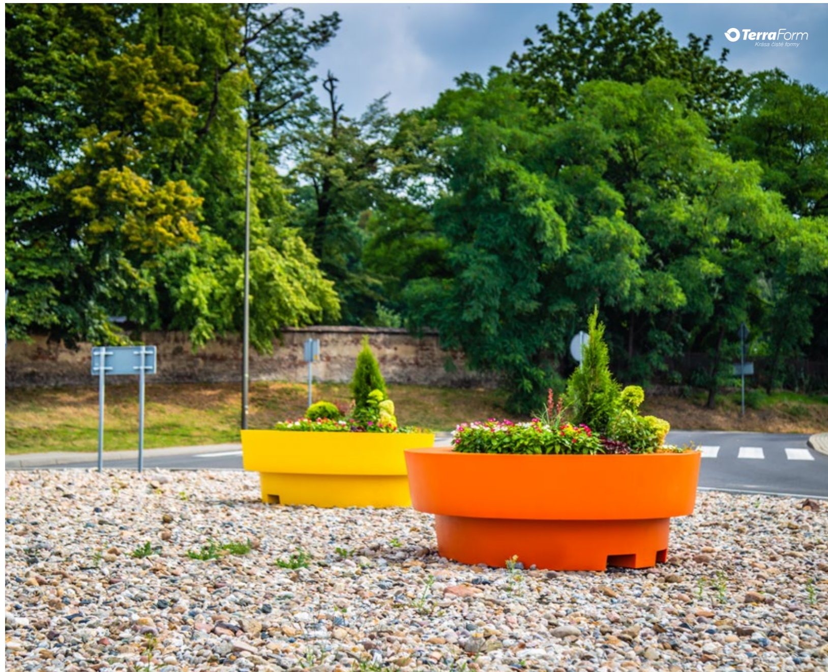
Květináče Gianto Sito Kvetináče Gianto Sito